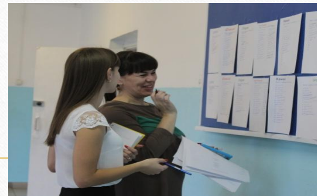
Работа дежурного учителя