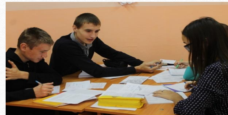
Взаимообмен заданиями. Математика