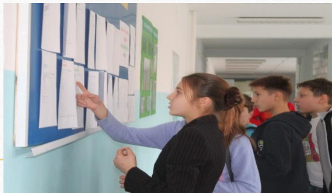
Составление ИОП на день