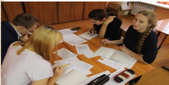
Методика взаимообмен заданиями. Математика